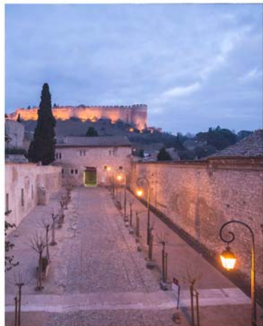
La Chartreuse, éclairée et vue de nuit.