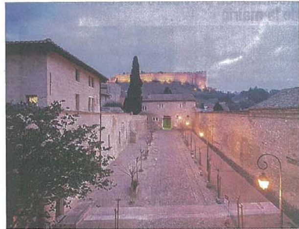
Cinq Nuits Secrètes qui seront l'occasion de rencontres avec les artistes en travail de création et découverte insolite du monument

L'entrée est gratuite dans la limite des places disponibles, réservation indispensable. (04 90 15 24 24).