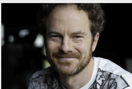
Boris Charmatz

Danseur, chorégraphe, mais aussi créateur de projets expérimentaux comme l'école éphémère Bocal, le Musée de la danse ou Terrain, Boris Charmatz va chercher la danse dans des endroits inhabituels. Il a été directeur du Centre chorégraphique national de Rennes et dernièrement du Tanztheater Wuppertal Pina Bausch. En 2011, artiste associé du Festival d'Avignon, il crée à la Cour d'honneur Enfant , pièce pour 26 enfants et 9 danseurs. Il y propose également « Une école d'art pour le Festival d'Avignon ». Soucieux de brancher ses propres questionnements sur l'état des corps contemporains, il conçoit des spectacles et formats hybrides qui, dans des espaces très divers, conjuguent création et répertoire, théorie et transmission.