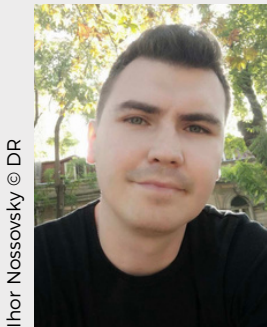
Ihor Nossovsky © DR

Les Post-it nous plonge dans un petit appartement situé dans une ville occupée, où cohabitent une fille et sa mère âgée. Les frontières entre réalité et souvenirs s'estompent peu à peu : la mère est piégée dans l'obscurité de sa mémoire défaillante, tandis que la fille sombre dans l'obscurité physique et morale de la ville occupée. À travers ce huis clos poignant, la pièce explore l'impuissance des individus face à la guerre, les décisions morales inacceptables qu'elle impose et la solitude qui s'empare des plus vulnérables. Une exploration intime et percutante de l'impact de la guerre sur les mondes intérieurs et les fragiles repères humains.