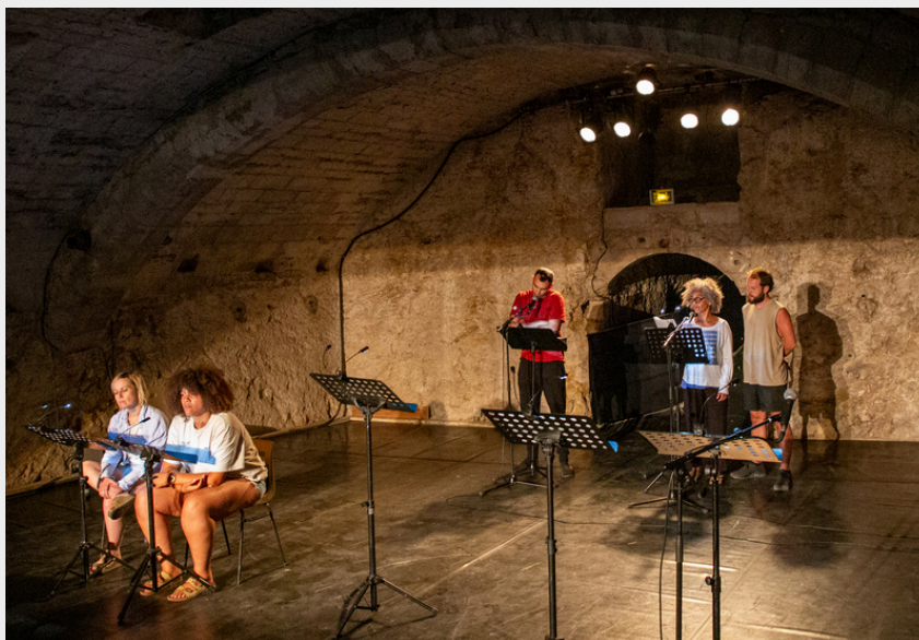
Rencontres d'été 2025 - lecture par le Graal