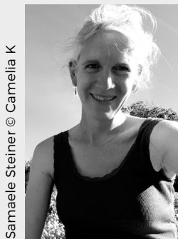
Samaele Steiner © Camelia K

Samaële Steiner nous livre une fable onirique queer qui dit en chœur l'importance de l'amitié et l'apprentissage de la liberté à l'adolescence. Une pièce vibrante emplie de sororité, de courage et d'espoir qui appelle à rêver grand en essayant de n'avoir ni peur ni honte de qui on est.