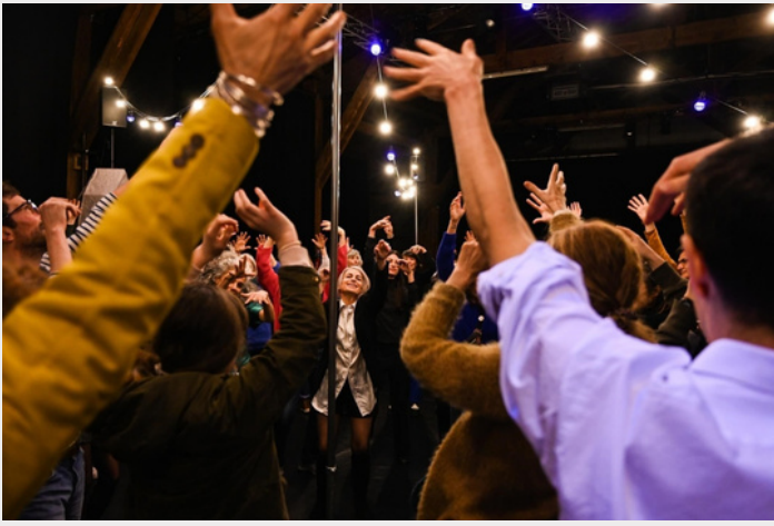
Bal Magnétique © Thomas Bohl