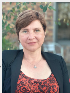
Jessica Biermann Grunstein

Nos territoires, est-ce le Sénégal, la Bretagne, La Paz ou Paris ? L'espagnol, le yiddish, le français, l'arabe, le créole, l'allemand, le malinké ou le serbo-croate ? Nos territoires de Jessica Biermann Grunstein fait des espaces linguistiques des territoires intimes, interroge ces objets de transmission ou de rejet, de richesse culturelle ou de honte sociale. Dans ces duos familiaux qui croisent les générations et les géographies, la langue est toujours ce qui sépare et relie les mémoires familiales, parfois trahies, et les rêves brisés toujours tenaces. Nos territoires fait de la parole un enjeu de reconquête de soi, réaffirme la force de l'héritage, et la valeur du multilinguisme sans prévalence de langue ni de culture. L'Arche éditeur coll. Des écrits pour la parole, 2025