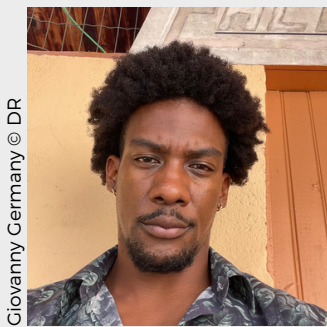
Giovanni Germany © DR

Dans un contexte de crise majeure en Martinique, La Vaillante met en scène la violence de l'effondrement d'une société brutalement coupée du reste du monde. Alors que toutes les communications extérieures sont interrompues, l'île plonge dans le chaos : pénurie alimentaire, violences, répressions et luttes de pouvoir fracturent la population. Cette fracture se répercute sur Kenny et Albane. Deux âmes liées que divise leur vision du monde.