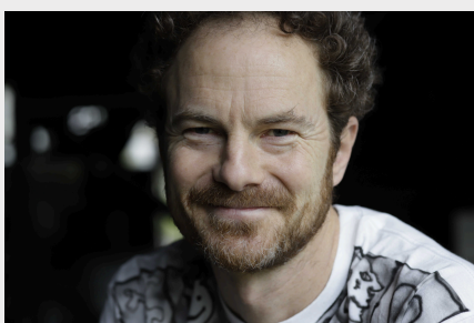
Boris Charmatz

Danseur, chorégraphe, mais aussi créateur de projets expérimentaux comme l'école éphémère Bocal, le Musée de la danse ou Terrain, Boris Charmatz va chercher la danse dans des endroits inhabituels. Il a été directeur du Centre chorégraphique national de Rennes et dernièrement du Tanztheater Wuppertal Pina Bausch. En 2011, artiste associé du Festival d'Avignon, il crée à la Cour d'honneur Enfant , pièce pour 26 enfants et 9 danseurs. Il y propose également « Une école d'art pour le Festival d'Avignon ». Soucieux de brancher ses propres questionnements sur l'état des corps contemporains, il conçoit des spectacles et formats hybrides qui, dans des espaces très divers, conjuguent création et répertoire, théorie et transmission.