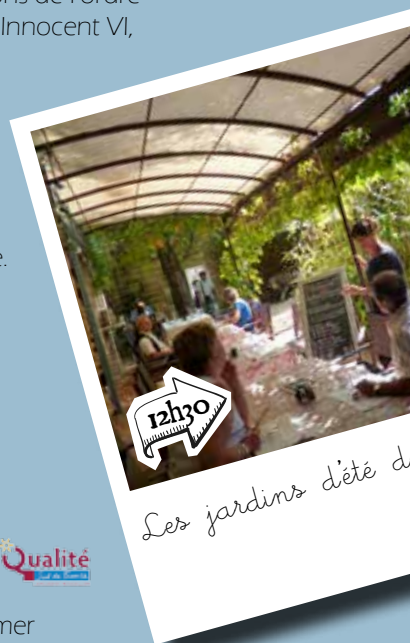
Les jardins d'été de la Chartreuse

Berceau de Villeneuve au X e siècle, l'abbaye bénédictine possède de magnifiques intérieurs baroques ainsi que des jardins à l'italienne.