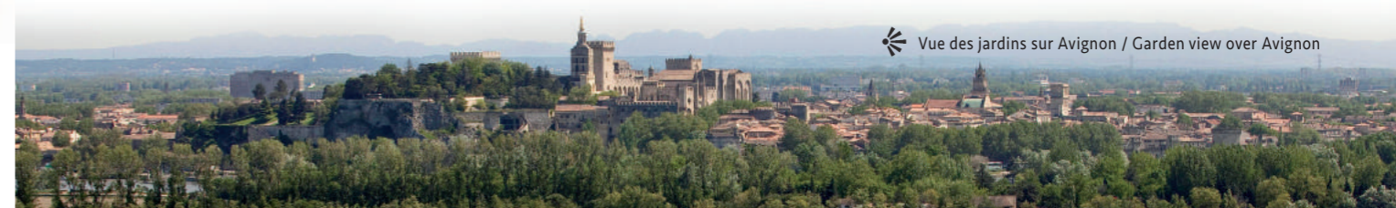
☀️ Vue des jardins sur Avignon / Garden view over Avignon

A remarkable suite of 17 th and 18 th century buildings showcases the work of the best architects of the time, most notably Pierre Mignard, the architect of King Louis XIV. The palace features stunning vaulted rooms and a succession of outstanding sculpted stone ceilings.