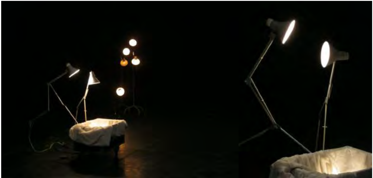
L'Enfant, La Mère & Le Père, Les Autres