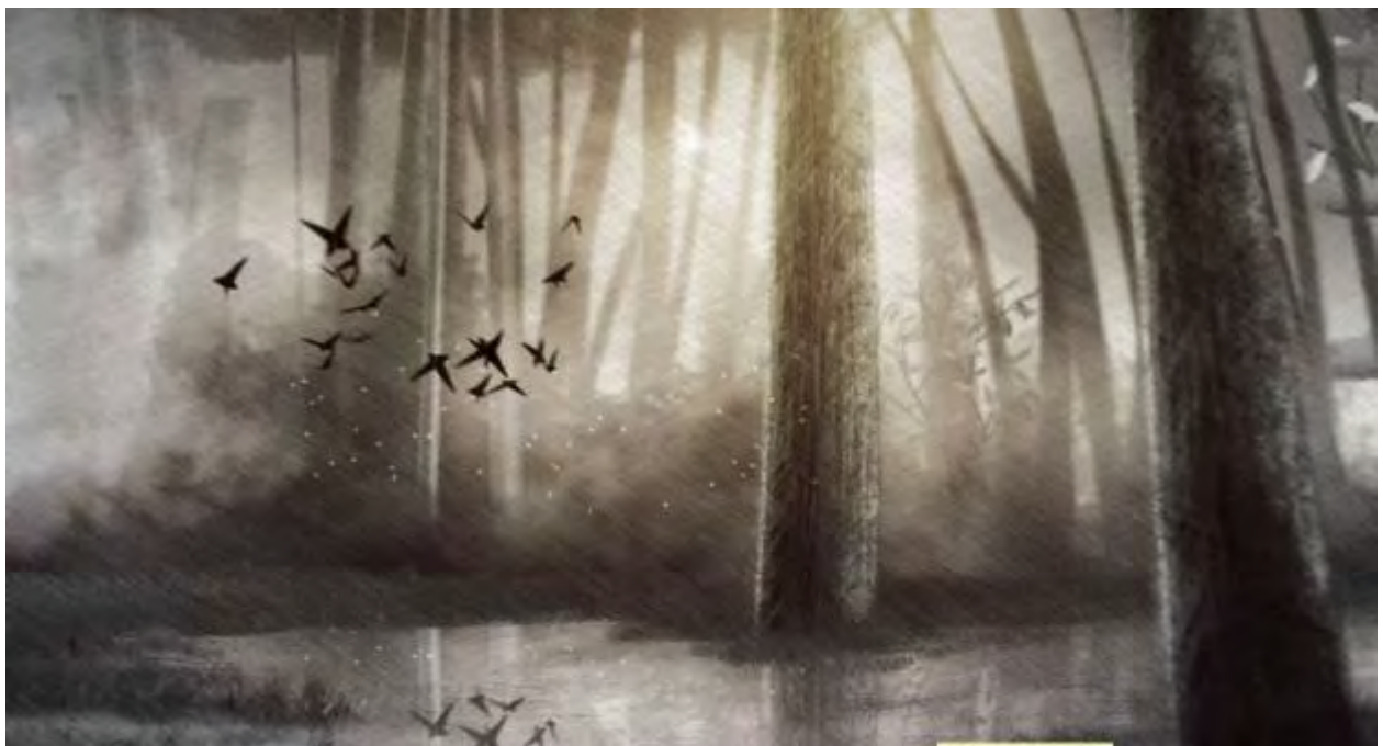
Extraits images animées maquette 2012

L'ensemble de l'image vidéo sera réalisé en animation 2D et 3D. Le point de vue de l'image sera toujours une vision subjective depuis les yeux de l'enfant, comme un souvenir, réminiscence. L'image sera en noir et blanc, travaillée graphiquement dans une esthétique BD, comme crayonnée. Elle passera à la couleur au Tableau 10.